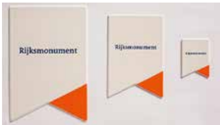
De nieuwe ANWB-gevelborden

Op 11 september 2014 heeft minister Jet Bussemaker het nieuwe monumentenbord onthuld bij de Ridderzaal in Den Haag, het eerste rijksmo-