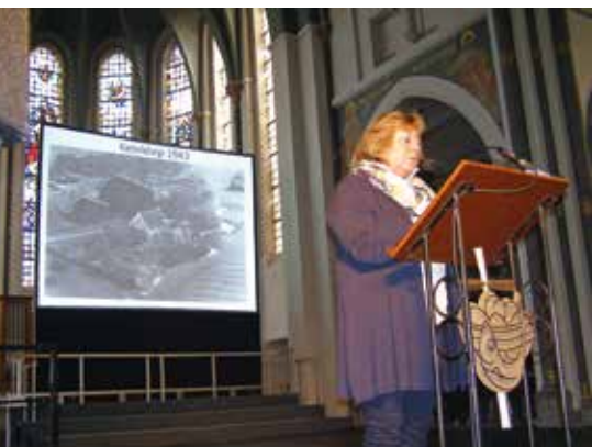
De bijeenkomst in Klundert