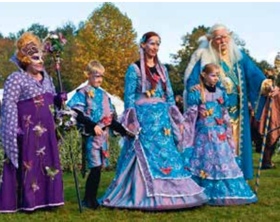
Op een fantasyfestival zie je de meest kleurrijke figuren

Jongeren willen volgens Ineke Strouken spanning in de historie brengen. Denk aan de re-enactmentgroepen en de fantasyfestivals, zoals tot 2014 in de bossen van Wouwse Plantage werden gehouden. „Jonge mensen willen de historie beleven, ze willen in de huid van de geschiedenis stappen. En heemkunde- en oudheidkundige kringen hebben een imago, ze hebben veel te bieden, maar dat moet dan wel op een andere manier om de jonge mensen te betrekken.“