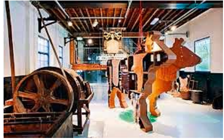
Het interieur van het museum De Looierij in Dongen