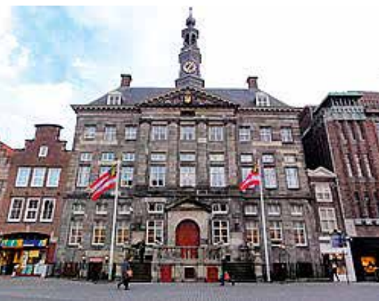
In het stadhuis van Den Bosch kwamen de Meijerijse kwartieren bijeen

rij zoal speelde. Het zijn meer de concrete belevenissen van de man en de vrouw in de straat om het wat populair uit te drukken.