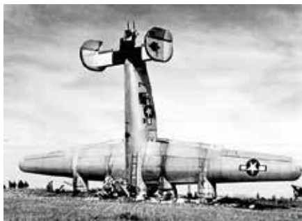
Een afbeelding uit het Fijnaartse boek

De schrijver ontvangt haast nog dagelijks informatie over vliegtuigen, waarover momenteel nog te weinig bekend is om hierover uitvoerig te berichten in dit boek. Het is de bedoeling dat het boek op 5 mei van dit jaar officieel gepresenteerd wordt. Op dit moment is de verkoopprijs nog niet bekend, omdat er nog steeds complete verhalen en foto's aan het boek toegevoegd worden. Zodra de inhoud van het boek bij drukker is, kan de verkoopprijs vastgesteld worden en die wordt vermeld op de website van de Heemkundige Kring Fijnaart en Heijningen ( www.heemkundigekringfijnaartenheijningen.nl ). U mag voor meer informatie ook een e-mail sturen naar heemkring-fh@kpnmail.nl .