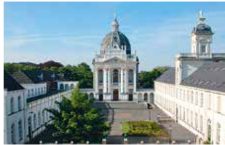
Een deel van het complex van Saint Louis in Oudenbosch