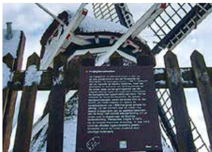
Een informatiebord zoals de ABWB dat kan leveren

Prijzen zijn afhankelijk van grootte en uitvoering. De ANWB maakt graag een passende offerte. Aanvragen kan bij monumentenbord@anwb.nl .