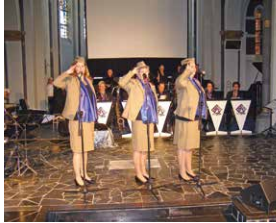
Bijzondere momenten tijdens 'Herinneringen aan november 1944' in Klundert