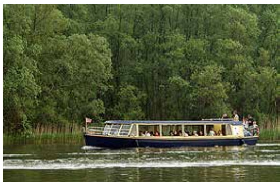
Op stap met de fluisterboot in de Biesbosch

18.00 uur: Diner en daarna muziek en quiz in het restaurant 'Het