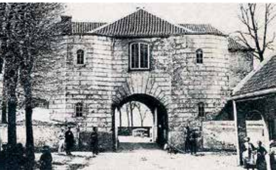
De Vughterpoort in Den Bosch waar de weg onderdoor liep

Luik en de Oostenrijkse Nederlanden, was het gevolg dat handelsverkeer vanuit Luik de haven van Antwerpen niet meer kon bereiken. De alternatieve routes liepen via Breda en 's-Hertogenbosch.