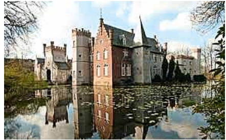
Kasteel Stapelen waar de contactdag plaatsvindt

Heemkundekring Boxtel verzorgt, in de rol van gastheer, 's middags twee presentaties, waarin de geschiedenis van Boxtel als verbindingspunt van verkeer en vervoer door de eeuwen heen centraal staat. De Dommel, die door Boxtel stroomt, was in de ijzertijd een belangrijke verkeersader. Uit de Romeinse weg die zich in Boxtel bevond, ontstond in het verleden een steenweg naar Luik. Denk ook