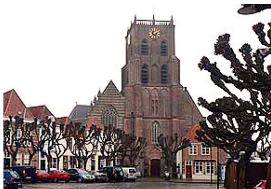
De Geertruidkerk in Geertruidenberg

17.00-18.00 uur: Allen op de fiets terug naar Made en daar de eigen fietsen op de auto zetten en de gehuurde fietsen inleveren.