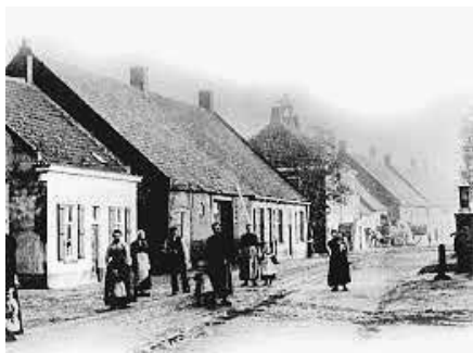
Een foto uit de collectie van het Regionaal Archief West-Brabant

Voordeel van het West-Brabantse archief is ook dat alles gedownload kan worden, zonder dat een wachtwoord of betaling vereist is. Het archief is te vinden op www.regionaal-archiefwestbrabant.nl