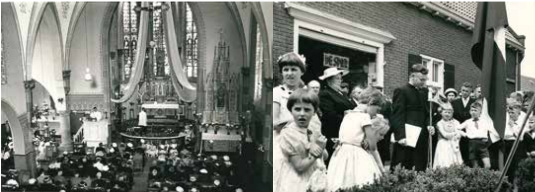
Twee foto's uit de serie die mogelijk in de buurt van Udenhout werden gemaakt

Het Heemcentrum 't Schoor in Udenhout is in het bezit van een fotoreportage die gemaakt is bij gelegenheid van de Eerste Plechtige Heilige Mis van een neomist in de parochiekerk van zijn woonplaats.