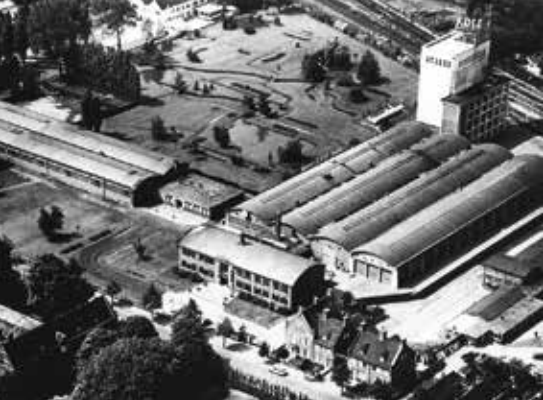
De inmiddels verdwenen Roosendaalse Ligafabriek

weld, de Roosendaalse zeeheld Hendrick Loncken, het oorlogsleed, de turfhistorie, de zorg voor arme sloebers en de industriële ontwikkeling. De jaarboeken vormen de oudste geschiedkundige periodiek in Noord-Brabant.